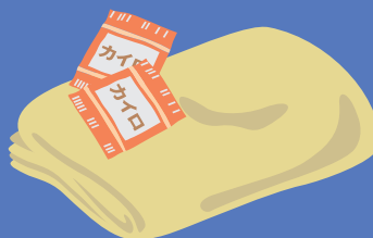
防寒用品(毛布・カイロ …とくに冬季)