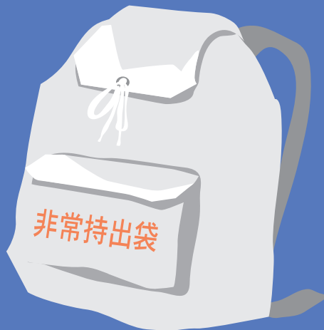
(マスク・消毒液・三角巾・包帯 ・胃腸薬・風邪薬)