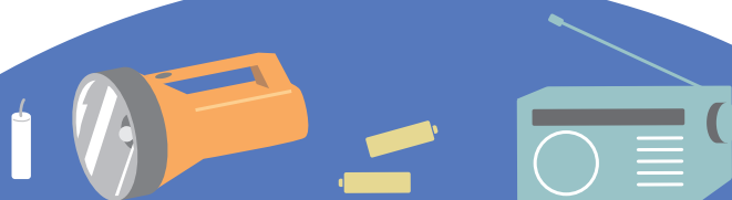
懐中電灯(+予備電池)またはロウソク

いざというとき、素早く逃げ出せるように、日頃から非常用持ち出し品を備え、 家族みんなて置き場所などを相談しておきましょう。 非常用持ち出し品の収納には、両手の使えるリュック型が最適です。 わが家に応じたものを準備しましょう。