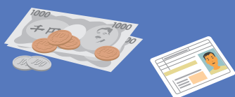
貴重品(現金・小銭)