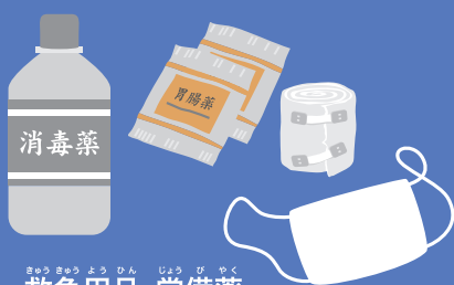
救急用品・常備薬