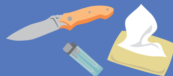
生活用品(ライター、 ナイフ、ティッシュ、 ビニールシート、 生理用品)